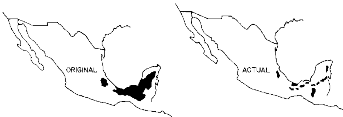
Figura 2. Comparación del estado original y actual de selvas alta y mediana subperennifolia del sureste mexicano. Fuente: Estrada y Coates (1995). Modificado por Sánchez y Rebollar.